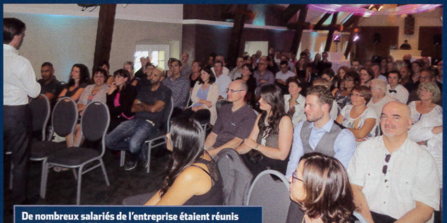
De nombreux salariés de l'entreprise étaient réunis pour fêter les 200 ans des moutardes Bornier.